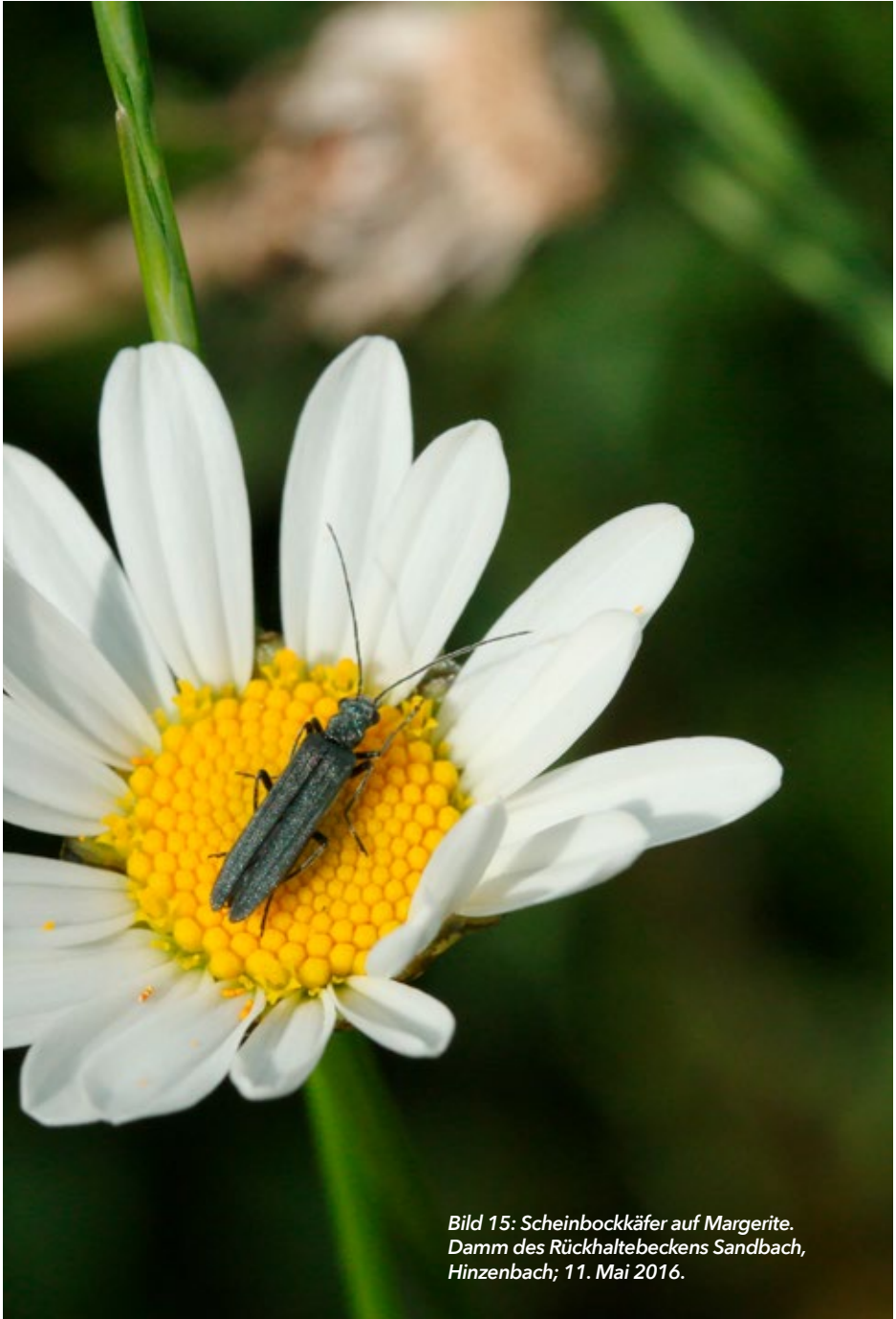
Bild 15: Scheinbockkäfer auf Margerite. Damm des Rückhaltebeckens Sandbach, Hinzenbach; 11. Mai 2016.