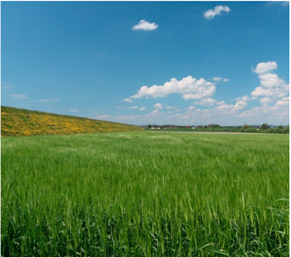
Bild 18: Mit einem dichten gelben Blütenflor bedeckt der Wundklee im Mai den Machlanddamm. Die Wildblumenbegrünung des Machlanddammes ist heute ein ökologisch hochwertiges Netzwerk im fruchtbaren Ackerbaugesamt des Machlandes; 9. Mai 2016.

ANTOINE DE SAINT-EXUPÉRY aus: Die Stadt in der Wüste