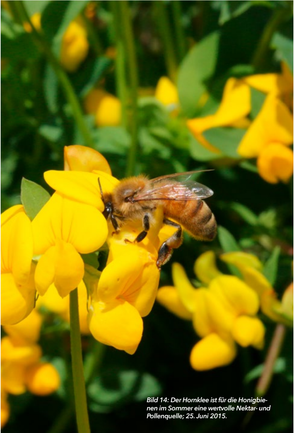
Bild 14: Der Hornklee ist für die Honigbienen im Sommer eine wertvolle Nektar- und Pollenquelle; 25. Juni 2015.