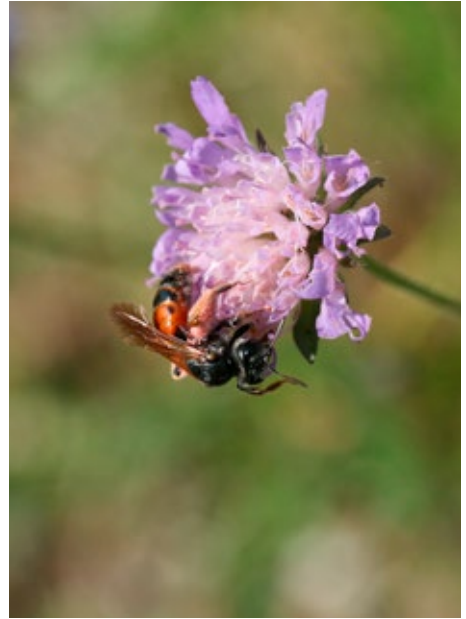
Bild 11: Auf Scabiosa und Knautia spezialisierte Witwenblume-Sandbiene auf Wiesen-Witwenblume; 28. September 2014.

Saatstärke: Bei den angeführten Mischungen ist eine Ansaatstärke von 1.000 bis 2.000 Samen/m 2 anzustreben, das entspricht einer Aussaatmenge von 1-2 g/m 2 . Letztendlich spielen mehrere Faktoren zur Bestimmung des tatsächlichen Aussaatgewichtes eine Rolle. Es ist zu beachten, dass konkurrenzschwache Arten (die meisten Blütenpflanzen) sich bei