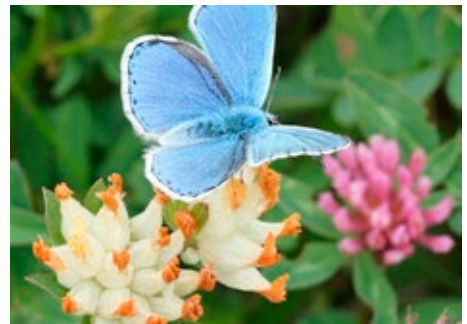
Bild 8: Himmelblauer Bläuling auf Wundklee. Machlanddamm; 19. Mai 2016.

Die Saatgutpreise für die ökologisch hochwertigen Wildblumenmischungen mögen auf den ersten Blick hoch erscheinen. Samen von diesen speziellen Wildblumen sind jedoch oft sehr schwierig zu produzieren. Die Preise sind letztlich auch Ausdruck der sehr hohen ökologischen Wertigkeit für Flora und Fauna. Umgerechnet auf den Quadratmeter relativieren sich jedoch die Saatgutkosten. Die einjährige „Gumpensteiner Feldblumenmischung“ kostet € 0,078 pro m 2 . Bei mehrjährigen Mischungen reduzieren sich die Saatgutkosten zusätzlich durch die langjährige Ausdauer. So kostet die „Wildblumen-Mischung Spezial“, auf 5 Jahre gerechnet, € 0,036 pro m 2 .