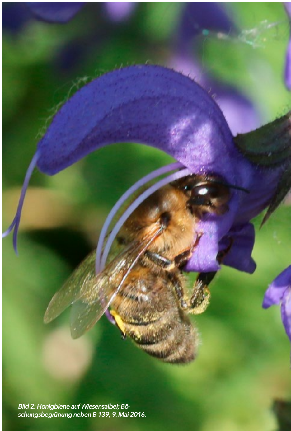
Bild 2: Honigbiene auf Wiesensalbei; Böschungs begrünung neben B 139; 9. Mai 2016.