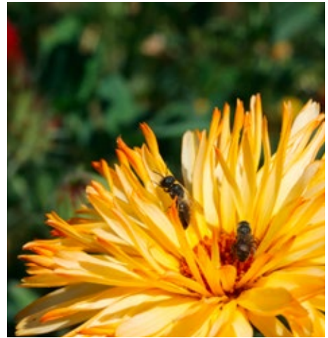
Bild 9: Auf den Blütenblättern der Ringelblume sitzt eine Scheinlappenbiene ; 6. August 2015.

Unverbindlicher Verkaufspreis: € 39,00/kg inkl. MwSt. (Stand 2016)