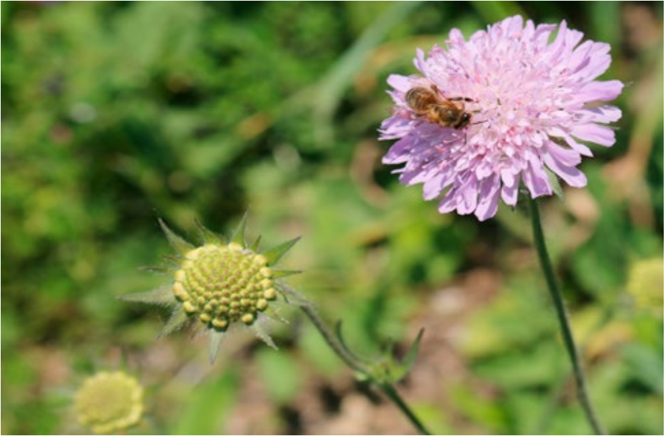
Bild 7: Für die Honigbienen ist die Wiesen-Witwenblume von Mai bis Juni eine wichtige Trachtquelle. Böschung B139; 9. Mai 2016.

sen als solchen erhalten zu können, werden Blühflächen mit Wildblumenmischungen ein bis zweimal im Jahr gemäht, je nach Bonität des Bodens.