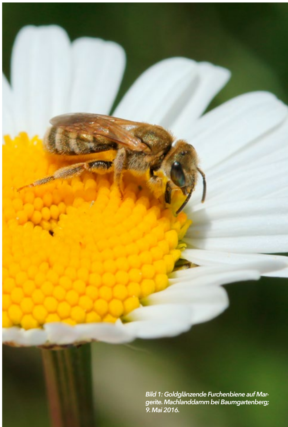
Bild 1: Goldglänzende Furchenbiene auf Margerite. Machlanddamm bei Baumgartenberg; 9. Mai 2016.