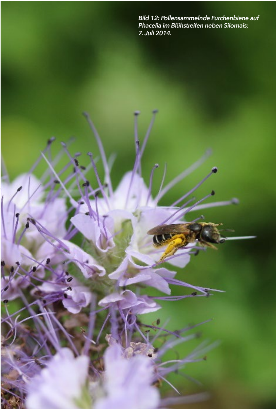
Bild 12: Pollensammelnde Furchenbiene auf Phacelia im Blühstreifen neben Silomais; 7. Juli 2014.