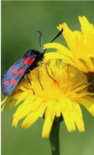
Bild oben: Falkkäfer auf Wiesen-Glockenblume; 28. Mai 2015. Bild rechts: Schwebfliegen-Art auf Schafgarbe; 30. Juli 2015. Bild unten: Sechsfleck-Widderchen auf Gewöhnlichem Ferkelkraut; 3. August 2014.