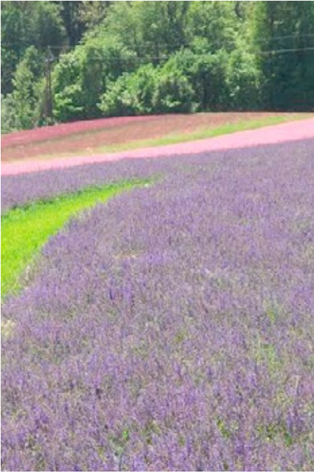
Bild 16: Regional zertifiziertes Wildblumensaatgut wird von oberösterreichischen Landwirten produziert. Hier: Wiesensalbei, Rote Lichtnelke und Kuckuckslichtnelke in Baumgartenberg im Bezirk Perg.

Das Anlegen von Blühflächen ist ein Beitrag zur Förderung dieser Bestäuber, aber nur dann, wenn eine richtige Auswahl an heimischen Pflanzenarten erfolgt und die übrigen Bedürfnisse der wilden Flieger (z.B. Nistplätze, Futterpflanzen für die Raupen) befriedigt werden. Damit sind Blühmischungen ein wesentlicher Teilaspekt in der Unterstützung dieser wichtigen Tierarten.