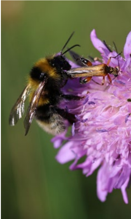
Bild 4: Gartenhummel und Scheinbockkäfer auf Wiesen-Witwenblume; 6. Juni 2014.

über den Winter stehen, mäht sie im zeitigen Frühjahr ab und anfangs Mai wird die neue Blumenmischung angebaut. Gartenfreunde können einen sehr wichtigen Beitrag für Bienen und Hummeln und damit für das ganze Ökosystem leisten. Werden viele Gärten bienenfreundlich gestaltet, entstehen größere und gute Bienenweiden. Entscheidend ist die Summe.