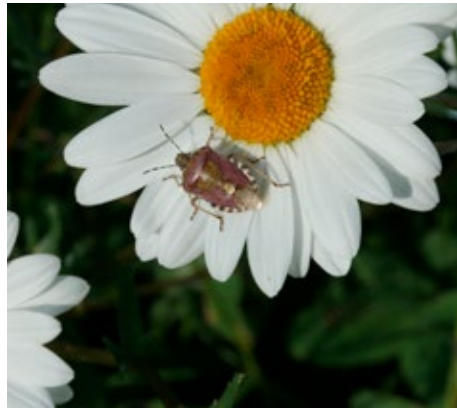
Bild 10: Beerenwanze auf Margerite. Damm des Rückhaltebeckens Sandbach, Hinzenbach; 11. Mai 2016.