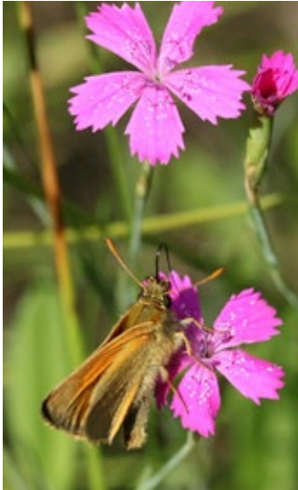
Bild oben: Hain-Schwebfliege vor Echtem Johanniskraut; 14. Juni 2014. Bild rechts: Männchen der Furchenbiene auf Echter Goldrute; 13. September 2015. Bild unten: Braundickkopffalter auf Heidenelke; 5. Juli 2015.