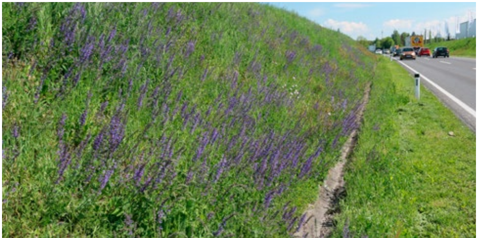
Bild 6: Böschungsbegrünung entlang der B 139 (Kremstalerstraße). Blühaspekt im Mai 2016. Anlage Mai bis Oktober 2008.

Zudem sind gegenüber der bisherigen Pflege Kosteneinsparungen von 20 bis 40 % zu erreichen. Während Grünflächen fünf bis sechs Mal im Jahr gemäht werden müssen, um den Ra-