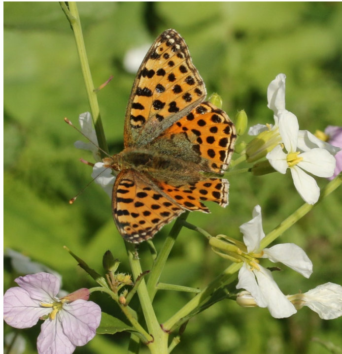
Kleiner Perlmutterfalter auf Ölrettich in der Mischung „Bienenfreund“ am 5. Oktober in Nußbach.