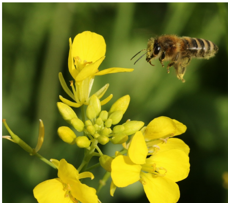
Bienenflug auf Gelbsenf der Mischung „Bienenfreund“ am 5. Oktober in Nußbach.

* aus der Dichte der Blütenstände wurde auf die Trachtwirkung geschlossen. Auch die Art spielt eine Rolle; so haben Senf und Phacelia eine höhere Attraktivität als Kresse oder Korbblütler wie Mungo.