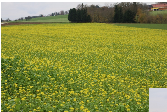
Zwischenfrucht am 9. November mit starker Trachtwirkung.

Allen Bemühungen mit Mischungszusammensetzung und Anbauzeitpunkt zum Trotz werden Einflussgrößen wie Temperatur, Niederschläge und deren Verteilung, Bodenbonität und Höhenlage immer wieder dazu führen, dass Zwischenfrüchte in der zweiten Oktoberhälfte und im November in Vollblüte stehen. Wenn dann ein typisches kaltes und feucht-nebliges Herbst- und Spätherbstwetter herrscht (wie 2017), ist die späte Vollblüte kein Problem. Bei länger andauernder milder Witterung mit Bienenflug-Temperaturen, können Maßnahmen zur Massereduktion den Aufwuchs einkürzen bzw. grob zerkleinern (z.B. mit Zetter) und damit die Trachtwirkung auf Bienen beenden. Eine leichte Restblüte stellt kein Problem dar. Gleichzeitig können damit die pflanzenbaulichen Anforderungen wie stabile Mulchdecke, gute Abtrocknung des Bodens im Frühjahr, erfüllt werden.