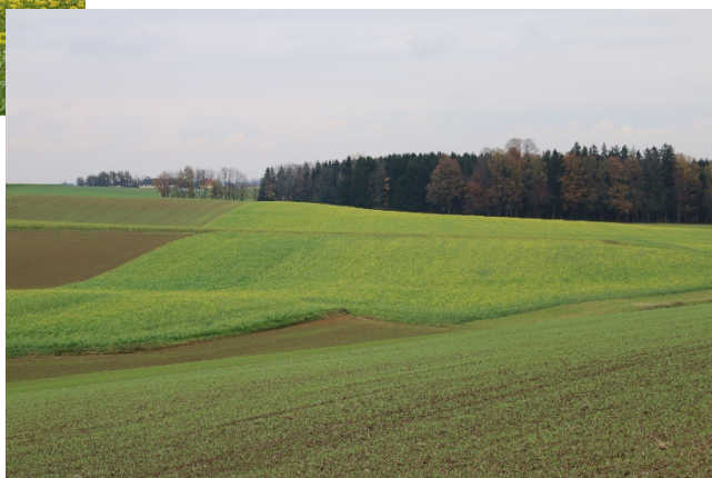
Zwischenfrucht am 9. November mit geringer Trachtwirkung.